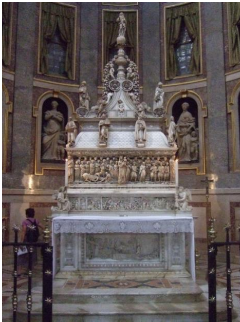
(Fig. 6) L'Arca di San Domenico Nicola Pisano Niccolò dell'Arca Michelangelo (Bologna)

Durante tutto il semestre, noi abbiamo parlato come le opere d'arte si siano evolute. Dal dipinto della Madonna dei Denti di Vitale da Bologna ai dipinti degli Caracci nel Palazzo Fava oppure nella Pinacoteca Nazionale a Bologna, noi abbiamo visto questi sviluppi all'intorno delle stille e anche le varie caratteristiche degli artisti. Come nella visita alla Chiesa di San Domenico per vedere L'Arca di San Domenico di Nicola Pisano, Niccolò dell'Arca e Michelangelo (Fig. 6) e per anche vedere Il Compito su Cristo Morto di Niccolò dell'Arca nella Chiesa di Santa Maria della Vita (Fig. 7), noi abbiamo l'opportunità e la capacità per costruire un confronto tra le due. A causa di tutta questa conoscenza, noi possiamo avere le conversazioni intorno ai confronti tra opere d'arte specifiche e poi noi hanno la comprensione per creare le nostre idee nelle cose che noi ci piace oppure no.