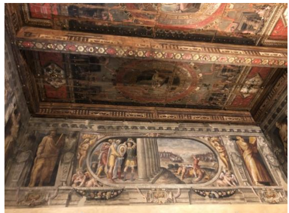
(Fig. 1) (a sinistra) (Fig. 2) (a destra) Sala di Davide (1552-1553) Bologna, Palazzo Poggi