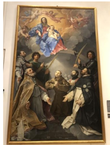
Fig. 4 La Pala della peste Guido Reni (1630) Bologna