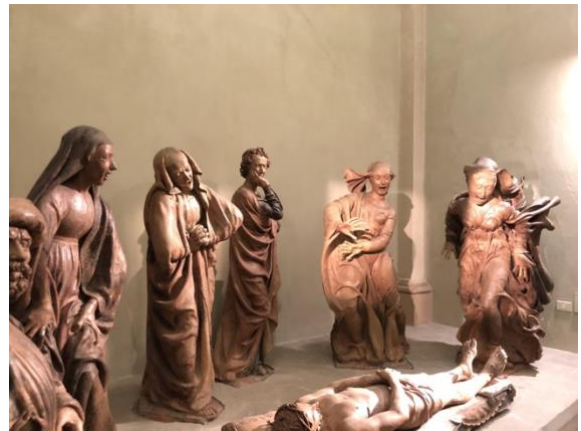
(Fig. 7.) Il Compito su Cristo Morto Niccolò dell'Arca Chiesa Santa Maria della Vita (Bologna)

In conclusione, queste conversazioni e anche queste esperienze mi ha dato la possibilità di pensare in modo critico delle opere d'arte. Questa classe era un tempo dei i miei studi che posso usare nel futuro quando vedrò le altre opere degli artisti differenti nel tutto il mondo. Adesso, sono in grado di utilizzare le varietà degli ideali per creare un argomento intorno alle opere d'arte specifiche. Ho una maggiore comprensione delle opere e di come gli stili si intrecciano tra di loro.