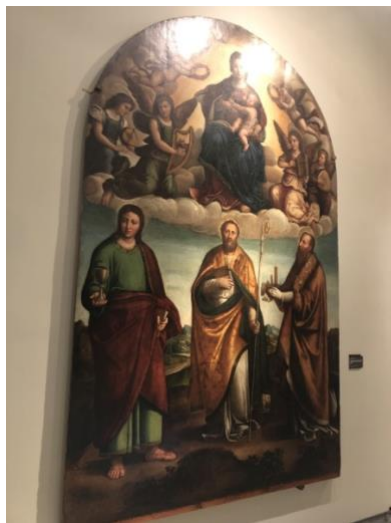
(Fig. 5) Madonna con Bambino adorata dai santi Giovanni Evangelista, sant'Eleutropio, San Petronio e angeli musicanti sulle nuvole Niccolò Pisano (1534). Bologna